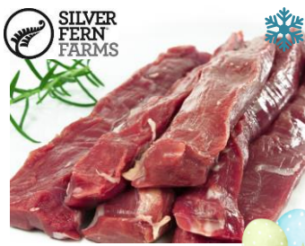
K13970 LAMMFILET, Neuseeland ca. 450g auf Tray