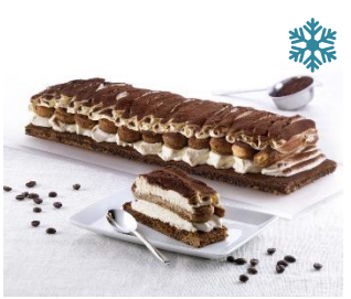
B1010952 TIRAMISÙ CON SAVOIARDI Kaffeedessert-Schnitte mit Mascarpone, 11 Portionen