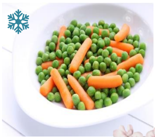
K20790 ERBSEN MIT FINGERMÖHRCHEN Der Mischgemüseklassiker