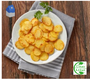
K10300 FRISCHE KARTOFFELSCHLEIBEN ggart, CLEAN LABEL, OHNE Zusatz v. Konservierungs- und Farbstoffen Ideal für Gratins oder Bratkartoffeln.