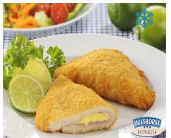
K14510 CORDON BLEU vom Schwein 160g , gewürzt & paniert, gefüllt mit zartschmelzendem Gouda & gekochtem Hinterschinken und knuspriger Panade umhüllt.