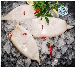
K17700 TINTENFISCHTUBEN U10 IQF einzeln entnehmbar