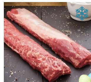
K50649 WILDSCHWEINRÜCKEN ohne Knochen, SP ca.1,2-1,4kg/Stk, einzeln vakuiert