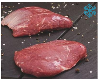
K13950 LAMMHÜFTSTEAK, Neuseeland ohne Deckel, 4 Stk. vakuiert ca. 1,2 kg

48x 125g /Kt 0,737 €/ Stk 36x 160g /Kt 0,866 €/Stk