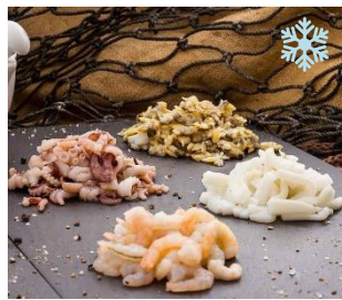
K17951 SEAFOOD COCKTAIL Meeresfrüchtemischung, mit Baby Octopus, Teppichmuschel, Tintenfisch & Shrimps