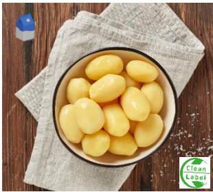
K10303 FRISCHE GARKARTOFFELN ggart, CLEAN LABEL, OHNE Zusatz v. Konservierungs- und Farbstoffen