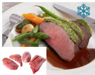
K50718 HIRSCHKEULE 4er Schnitt ohne Knochen, Neuseeland Ober-/Unterschale, Nuß, Hüfte