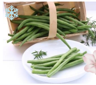
K20280 PRINZESSBOHNEN Passt perfekt zu Lamm