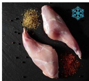
K50920 KANINCHENKEULEN 225 - 275g, einzeln entnehmbar