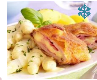
K15500 HÄHNCHEN CORDON BLEU 150g Hähnchenbrustfilet gefüllt mit Putenkochschinken & Käse in knuspriger Panade.