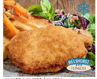
K14470 / K14500 / K14504 SCHWEINELACHSSCHNITZEL (PANIERT, 120g, 160g, 200g) aus frischen, saftigen Lachsen geschnitten, flüssig gewürzt & paniert