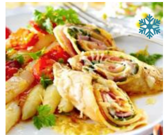
K43300 EIERPFANNKUCHEN 70g Natur, beidseitig gebacken & 1x gefaltet. Ideal für herzhaft oder süß