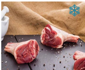
K13920 LAMMHINTERHAXE, Neuseeland 2 Stk. vakuiert, ca. 750-950g