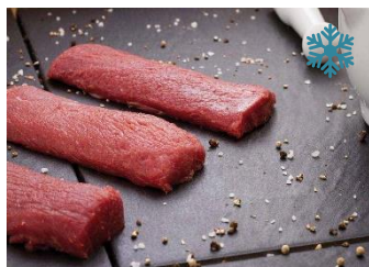
K13960 LAMMLACHSE, Neuseeland Rücken oh. Knochen, 4 Stk auf Tray ca. 650g