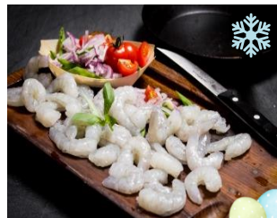
K17890 / K17891 / K17892 SEAWATER- GARNELEN roh geschält, ohne Kopf je 10x 1kg / KT

31/40 9,95 €/ kg* 26/30 10,45 €/ kg* 16/20 11,85 €/ kg*