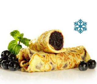
K43320 EIERPFANNKUCHEN mit Heidelbeerfüllung

beidseitig gebacken & 2x gefaltet. Ideal als Dessert z.B. mit einer Kugel Eis oder Solo