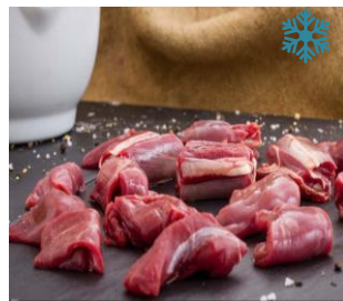
K50771 HIRSCHGULASCH „Standard“ handgeschnitten