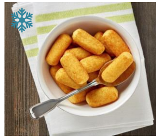
K10023 TIFA KROKETTE CLASSIC Vorgebacken aus gesunden, reifen Speisekartoffel, ca.20g/Stück