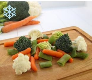
K20900 GALA GEMÜSEMISCHUNG Fingermöhren, Blumenkohl, Romanesco, Broccoli, Zuckerschoten