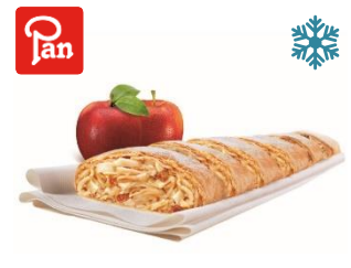
C12509 / C12500 PAN APFELSTRUDEL SCHNITTE fertig gebacken & portioniert

31/40 9,95 €/ kg* 26/30 10,45 €/ kg* 16/20 11,85 €/ kg*