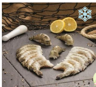
K17781 BLACK TIGER RIESENGARNELEN „Easy Peel“ 13/15 ohne Kopf, mit angeschlitzter Schale