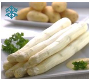
K20991 STANGENSPIRGEL WEISS geschält, Medium, ca.17cm lang Ø ca.10-12mm