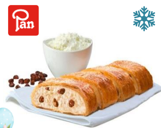
C12501 PAN QUARKSTRUDEL SCHNITTE fertig gebacken & portioniert