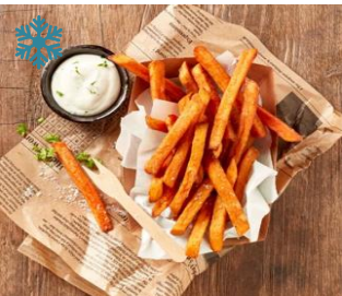
K10275 SÜßKARTOFFEL-POMMES Sweat Potato Fries – mit knusprigem Überzug, vorgebacken & lecker